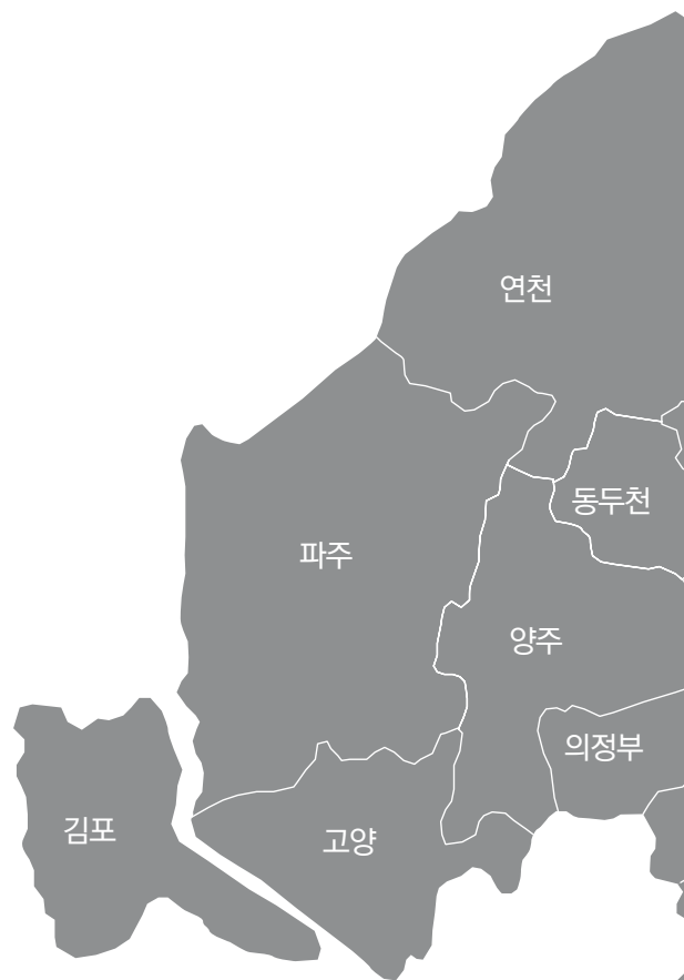
경기도교육청 지역별 학교 수 (기준일 2023.09.30.)