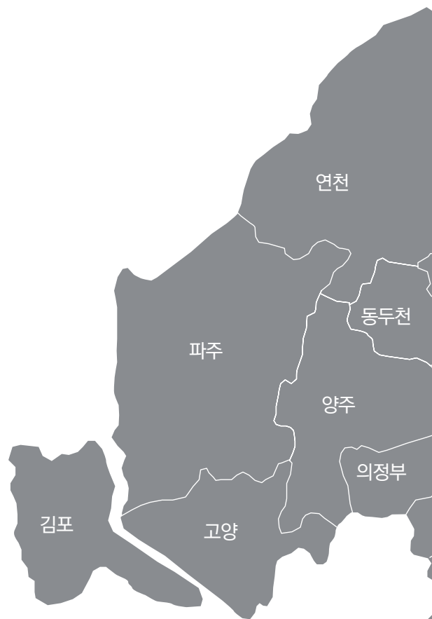
경기도교육청 지역별 학교 수 (기준일 2023.09.30.)